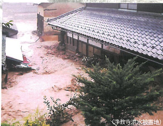
(浄教寺洪水被害地)

交通案内 バス:JR福井駅前(市内バス⑩番のりば) —(約10分)—福井大学前下車 えちぜん鉄道:福井駅—(約15分)—福大前西福井下車