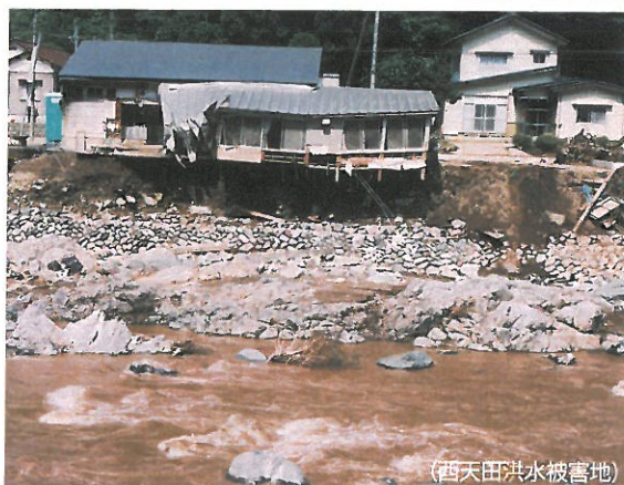
(西天田洪水被害地)