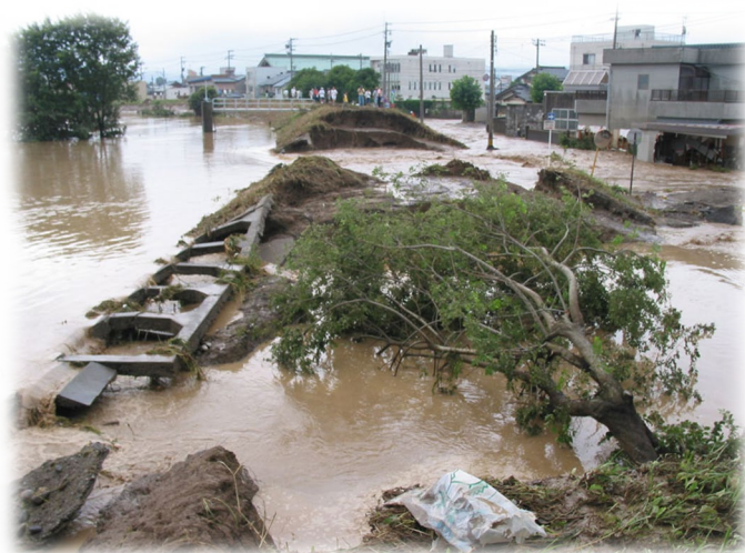
破堤した足羽川堤防